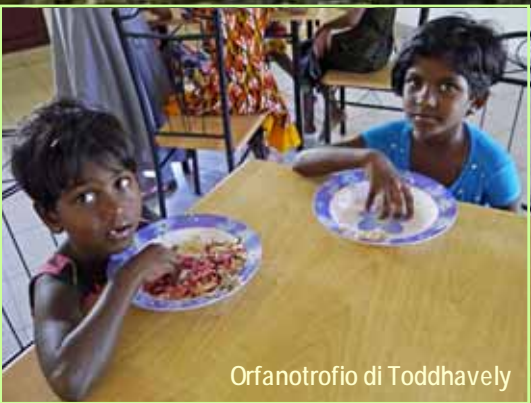
Orfanotrofio di Toddhavely