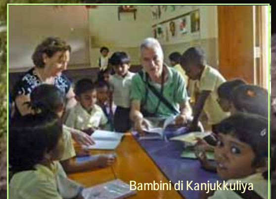
Bambini di Kanjukkuliya