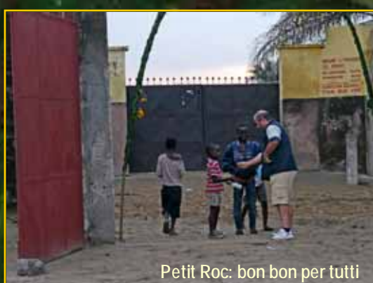
Petit Roc: bon bon per tutti