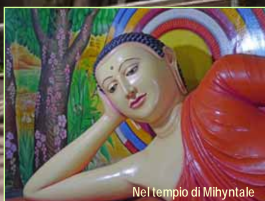
Nel tempio di Mihyntale