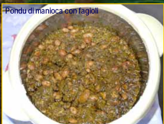
Pondu di manioca con fagioli