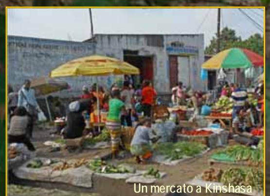
Un mercato a Kinshasa