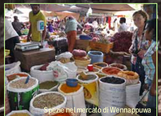
Spezie nel mercato di Wennappuwa