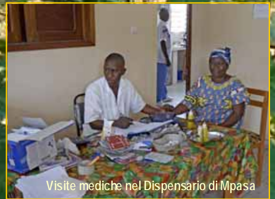
Visite mediche nel Dispensario di Mpsa