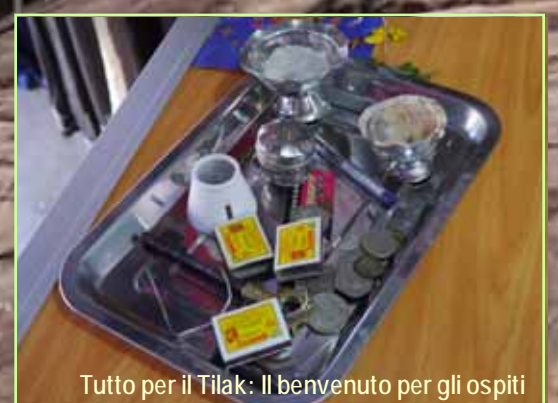
Tutto per il Tilak: Il benvenuto per gli ospiti