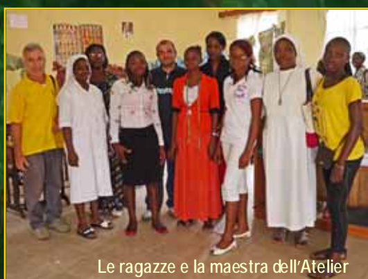
Le ragazze e la maestra dell'Atelier