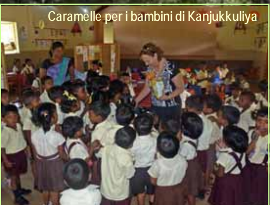
Caramelle per i bambini di Kanjukkuliya