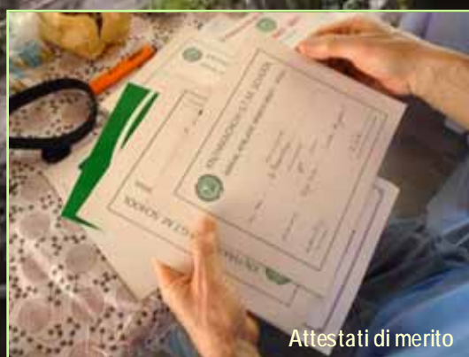
Attestati di merito