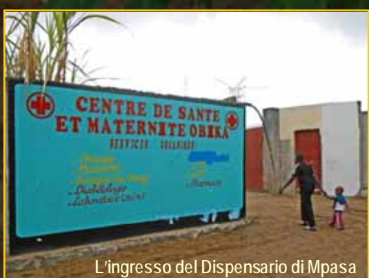
L'ingresso del Dispensario di Mpsa