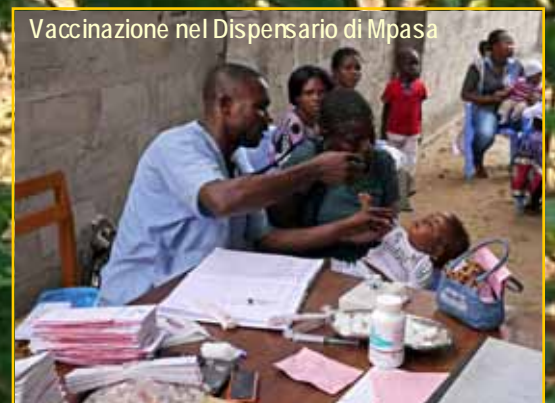
Vaccinazione nel Dispensario di Mpsa