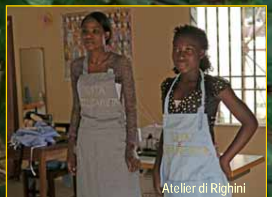
Atelier di Righini