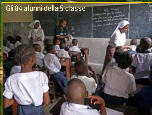
Gli 84 alunni della 5 classe