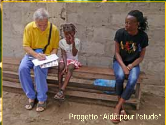
Progetto "Aidè pour l'etude"