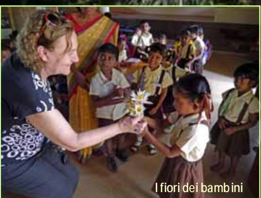
I fiori dei bambini