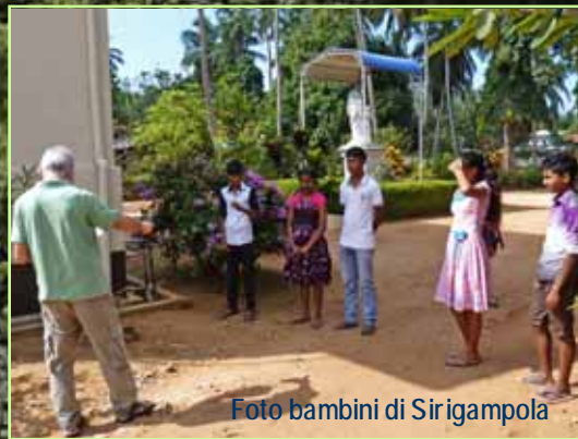
Foto bambini di Sirigampola