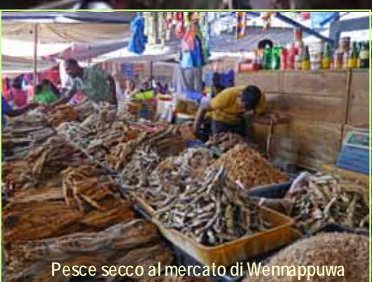
Pesce secco al mercato di Wennappuwa