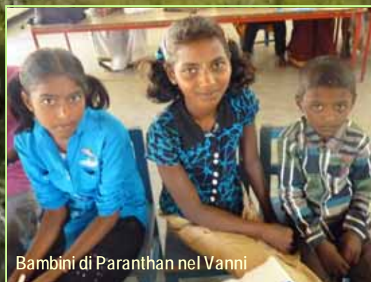
Bambini di Paranthan nel Vanni