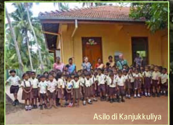
Asilo di Kanjukkuliya