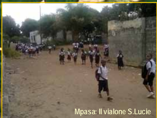
Mpsa: Il vialone S.Lucie